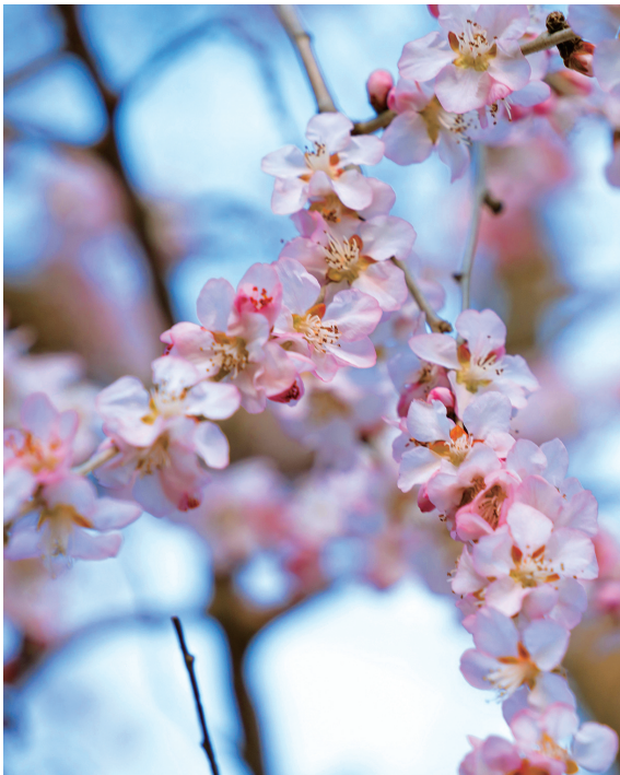
位于朝阳区六里屯地区的二道沟河两岸，桃花初放，春意融融。