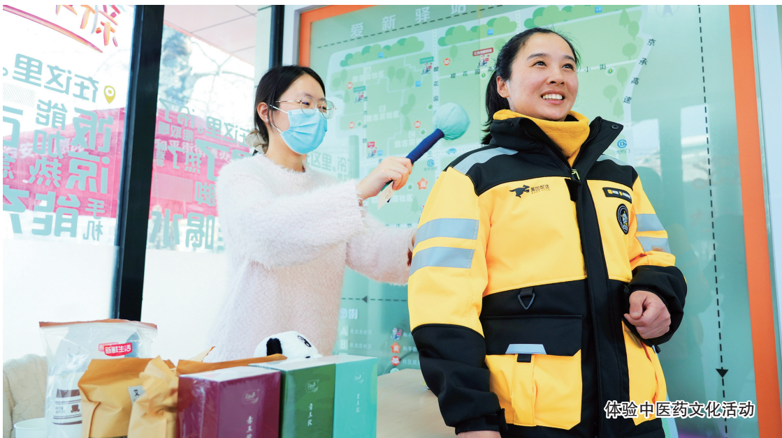
体验中医药文化活动

望京街道举办“共朝美好 众望京彩”“三八”国际劳动妇女节主题活动，以花为媒，邀请为望京地区作出贡献的优秀女性职工进行主题分享，精心打造专属女性的温馨交流空间，展现女性在职