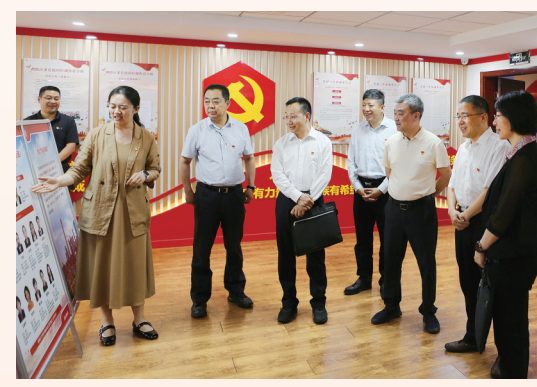
全国、北京市、朝阳区三级政协支部联合开展主题党日