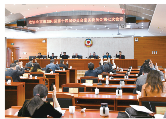
朝阳区政协召开十四届七次常委会会议