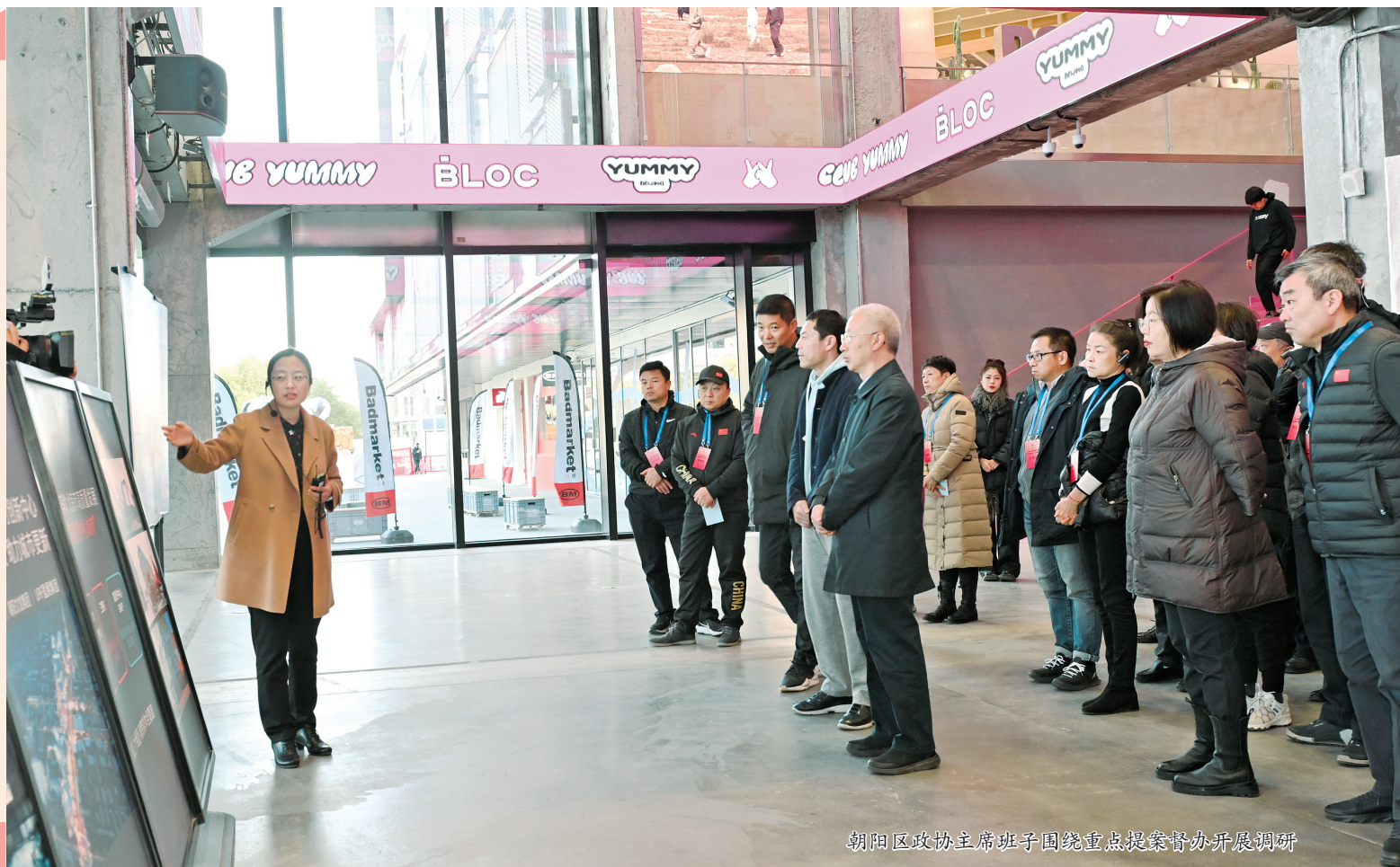
朝阳区政协主席班子围绕重点提案督办开展调研

2023年,在中共朝阳区委领导下,区政协常委会以习近平新时代中国特色社会主义思想为指导,深入学习贯彻中共二十大精神和习近平总书记对北京一系列重要讲话精神,坚持服务中心大局,围绕推动朝阳高质量发展和“五宜”朝阳建设,突出讲政治、讲民主、讲团结、讲担当、讲效能,切实履行专门协商机构职能,在新时代新征程上展现了政协新形象,作出了政协新贡献。