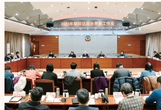
朝阳区政协召开界别工作会